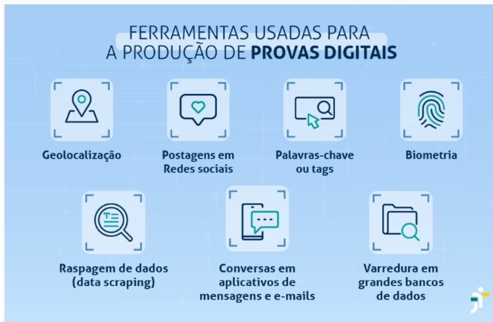
Figura 3. O box acima traz exemplos de provas digitais extraídas de fontes abertas e fechadas.

Se considerarmos o ambiente interno, foram aplicadas medidas que facilitaram a comunicação entre Tribunais e também entre unidades do CSJT. No âmbito tático-operacional , foi instituída a ferramenta Jira como o meio principal de comunicação institucional da TIC com os dirigentes de TIC, o que trouxe celeridade e transparência nas ações relacionadas à tecnologia da informação. Ainda como iniciativa interna, mas com impacto inclusive nos clientes do CSJT, foi instituída a pesquisa de satisfação das unidades deste Conselho, com registro telefônico sobre o atendimento aos usuários realizado pelos servidores.