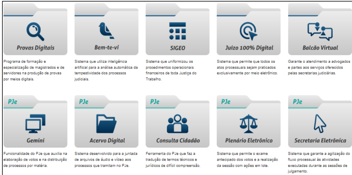
Figura 2. Visão geral dos sistemas componentes da Justiça 4.0 na JT

e para suporte às atividades fins e à adesão ao Programa Justiça 4.0 foram os objetivos que impulsionaram a transformação digital na justiça do trabalho no período de 2020 a 2022, abrangendo, neste período, duas gestões no TST/CSJT: Ministra Maria Cristina Irgoyen Peduzzi, biênio 2020/2022 e Ministro Emmanoel Pereira, biênio 2022/2024.