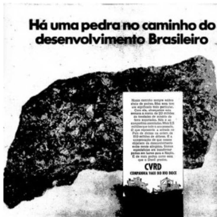
Figura 1. Foto do anúncio publicitário do jornal O Globo . Fonte: https://ogimg.infoglobo.com.br/in/23410770-961-208/ft460b/300/vale-drummond.jpg . Acesso em 01 dez. 2022.

Assim é que, em 1970, ao comemorar o sucesso do Projeto Cauê, a Companhia Vale do Rio Doce publicou um anúncio publicitário no jornal O Globo onde ela se apropria do poema da pedra no meio do caminho , convertendo-a em argumento apologético aos seus próprios objetivos exploradores. No título da publicação, destacado em negrito, o verso “no meio do caminho tinha uma pedra” foi alterado para “há uma pedra no caminho do desenvolvimento brasileiro.