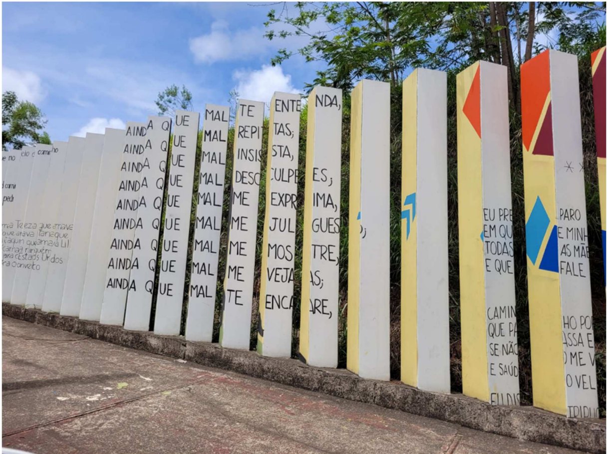
Figura 2: Muro da ferroviária de Itabira visto no sentido bairro-centro da cidade. Itabira, dezembro de 2022.

Mas o que mais chama a atenção é o aproveitamento dos seus poemas pela própria mineradora que ele tanto combateu com seus escritos. Parte dos muros de proteção da linha férrea, especialmente aqueles próximos à ferroviária de Itabira, receberam uma pintura artística (e que ficou muito bonita, diga-se de passagem), onde foram gravados alguns versos dos poemas de Drummond, como se pode ver nas figuras 2 e 3, abaixo.