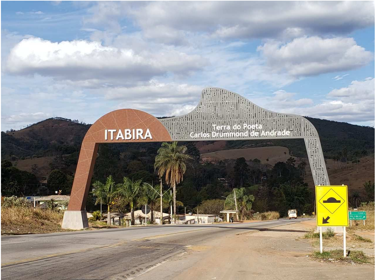
Figura 5: Visão do Portal no sentido Itabira, instalado em 2021. Na fotografia, vê-se o Pico do Cauê estampado à direita da imagem, onde está escrito “Terra do Poeta Carlos Drummond de Andrade”. Itabira, dezembro de 2022.