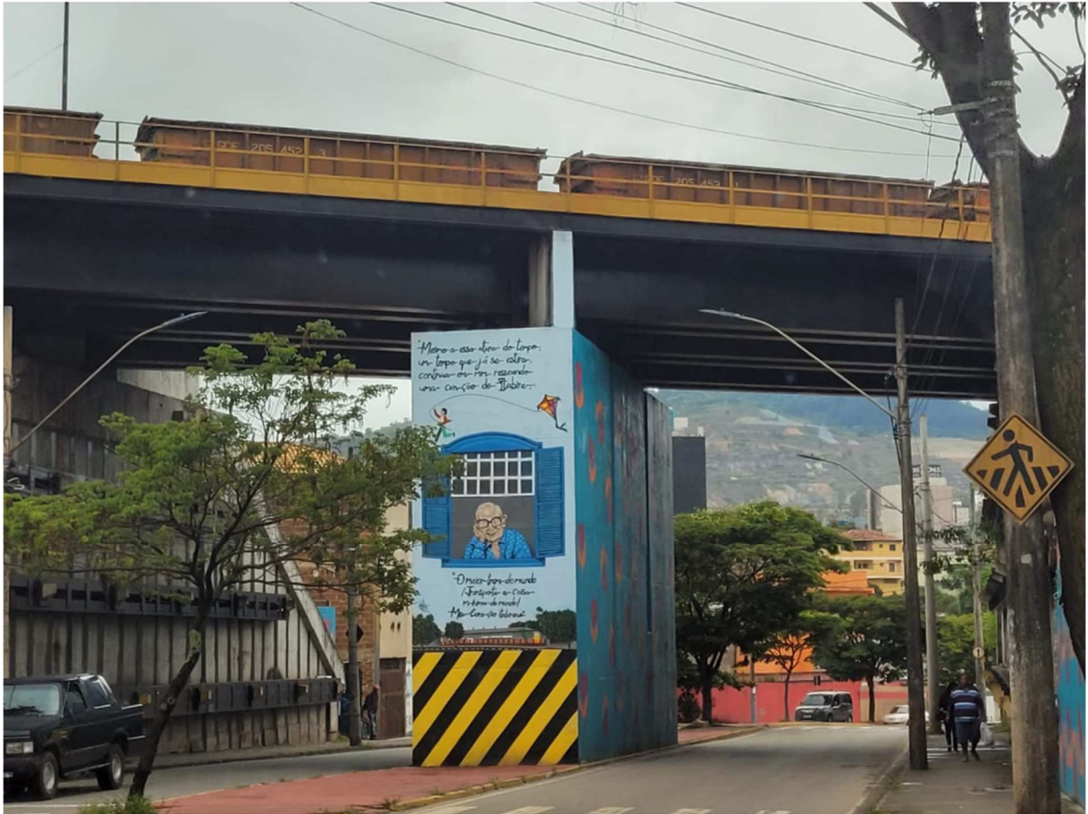
Figura 4: Foto do túnel do bairro Major Lage de Baixo visto no sentido bairro-centro da cidade. Na parte inferior do pilar central está escrito parte do poema O maior trem do mundo . Acima, vê-se os vagões vindos dos portos de Vitória/ES para carregarem com o minério de Itabira. Itabira, dezembro de 2022.

Assim como o poeta, outra figura intimamente ligada à cidade é o Pico do Cauê, que não mais existe, a não ser como presença alucinada de uma ausência 15 . Conforme já mencionado, a Companhia Vale do Rio Doce foi criada, especificamente, para explorar, comercializar e transportar o minério de ferro do Pico do Cauê quando, em 1942, o Brasil passou a participar da Segunda Guerra Mundial para o fornecimento de ferro para os seus aliados. A montanha, com seu excepcional teor médio de ferro, foi pulverizada pela mineradora, a ponto de abrir uma enorme cratera onde ela se localizava (figura 6), que desce ao nível do solo quase na mesma profundidade quanto o era de altura. Mesmo assim, Itabira/Vale se orgulham de exibir fotografias, histórias e artes relacionadas à montanha como se ela ainda existisse, é o que se nota na figura 5.