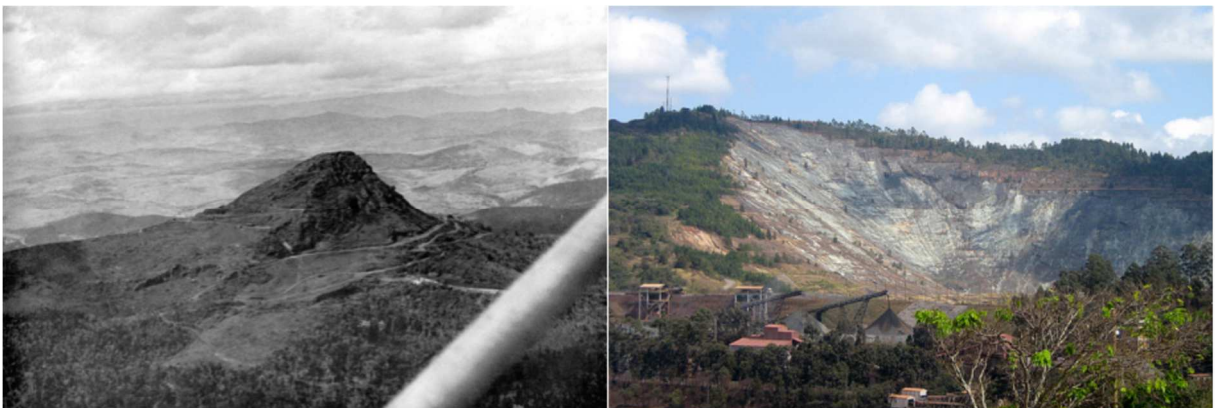
Figura 6: A montagem de fotografias de Cristiane Magalhães para o Blog Revista Dois Pontos mostra, à esquerda, o Pico do Cauê em 1942 e, à direita, o “Buraco do Cauê” em 2007. Atualmente, esse “buraco” está bem mais profundo, pois a exploração do minério ainda permanece.

De acordo com Minayo (2004, p. 396), o nível de dominação que a Vale exerce sob Itabira, mediante a abrangência dessas múltiplas estratégias, ocorreu de forma mais intensa nos primeiros 40 anos da sua história, diferenciando-se nesses últimos 40 anos. A Vale construiu uma visão de cidadania centralizada no mundo do trabalho, que “se deu pela intensificação do