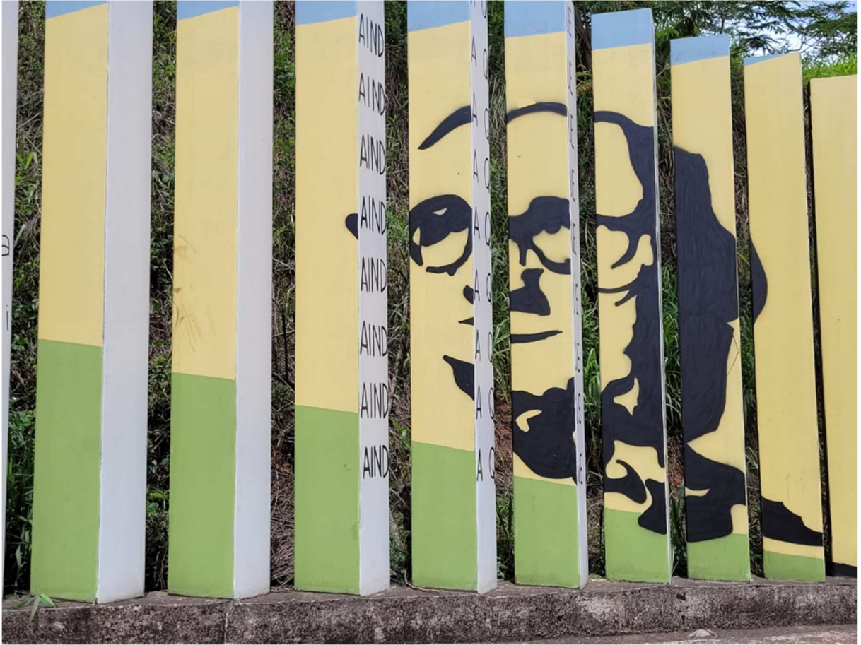
Figura 3: Muro da ferroviária de Itabira visto no sentido centro-bairro. Itabira, dezembro de 2022.

Como se não bastasse a tentativa de captura dos poemas pela mineradora, muitos dos quais ela suprime os versos que a ataca diretamente, embaixo do túnel onde passa “o maior trem do mundo”, que leva ao mundo inteiro o “tempo”, a “infância” e a “vida” do poeta e de todos os itabiranos “triturada em 163 vagões de minério e destruição” e que transporta o seu “coração Itabirano”, a Vale fez outra pintura artística (também muito bonita), que utiliza exatamente esse poema ( O maior trem do mundo ), mas, é claro, utilizando somente a parte que ela julgou conveniente aos seus interesses, conforme pode ser notado na figura 4, abaixo.